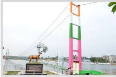
SIDDIPET AIR BRIDGE