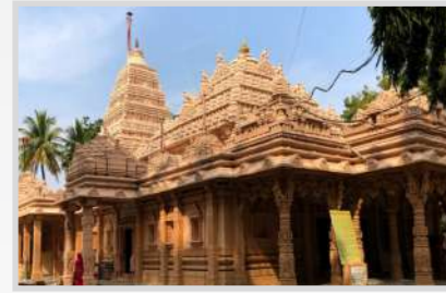
KOLANUPAKA JAIN TEMPLE