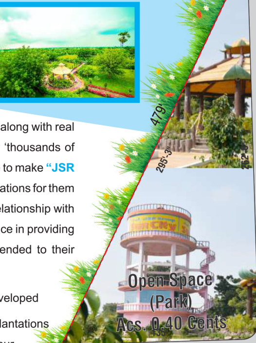
Open Space (Park) Acs. 0.40 Cents