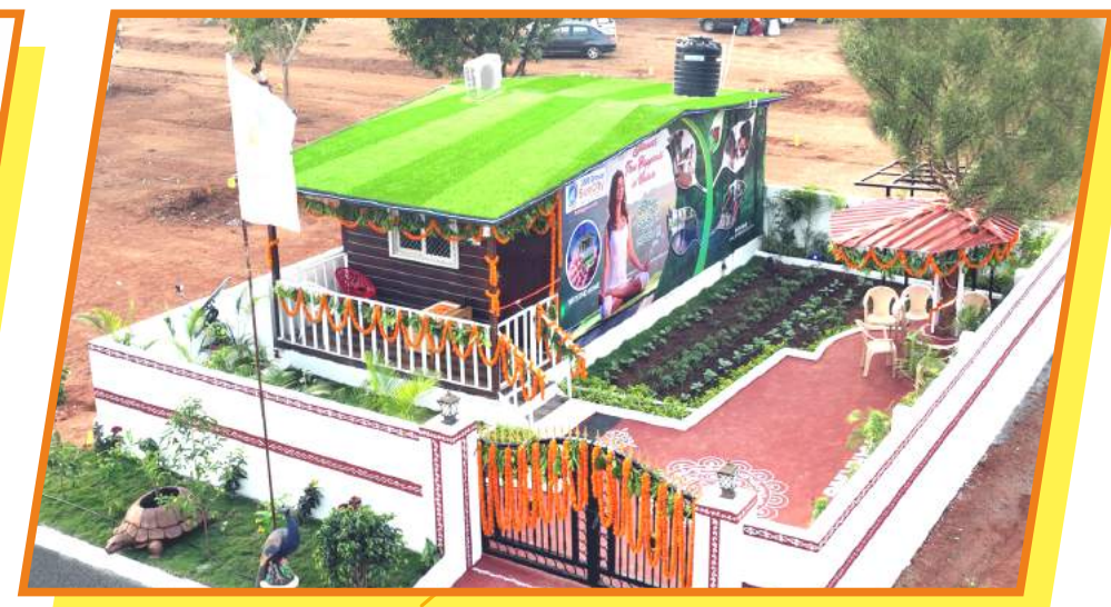
MODEL WEEKEND HOME