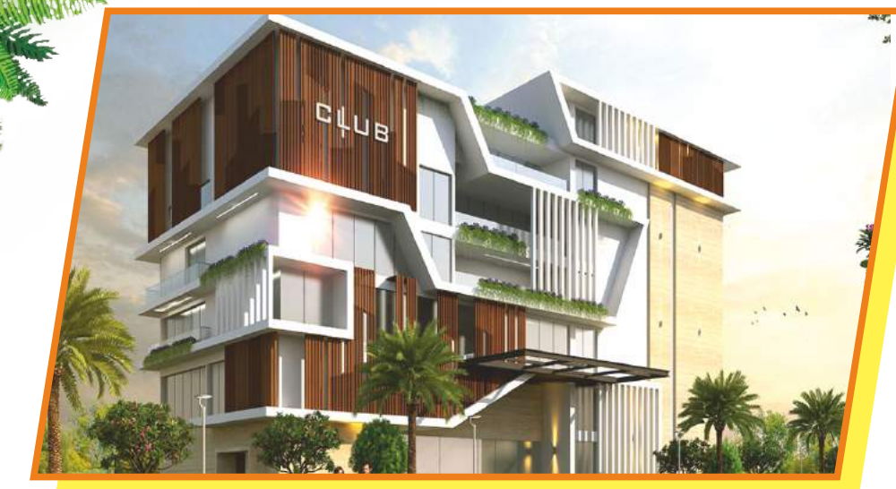
FREE CLUB HOUSE MEMBERSHIP IN CAPITAL-II